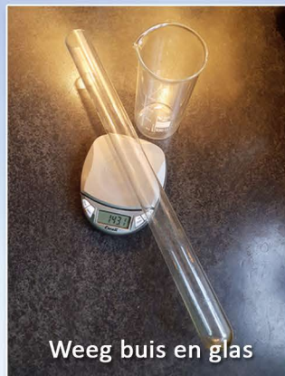
Weeg buis en glas