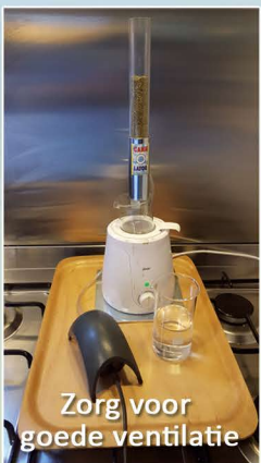
Zorg voor goede ventilatie

Bedenk dat aan cannabis in 10.000 jaar nog nooit iemand is overleden en dat een patiënt het recht heeft om alles te doen en te gebruiken dat de kwaliteit van zijn leven kan verbeteren. Wietolie is niet schadelijk of verslavend, je gebruikt wietolie omdat het móet en niet voor de lol.