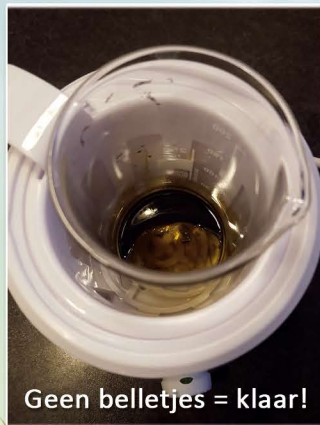
Geen belletjes = klaar!